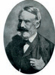
Victor Hugo gravure

L'un des plus grands écrivains français, s'est engagé contre les inégalités sociales et la peine de mort. Il a écrit Les Misérables et Notre-Dame de Paris .