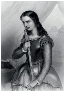
Jeanne d’Arc gravure 1858

Jeanne d’Arc (1412-1431). Pendant la guerre de Cent-Ans contre l’Angleterre, cette jeune paysanne conduit les troupes françaises à la libération d’une partie du territoire français. Cette héroïne nationale incarne le courage au service de la France.