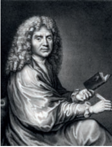
Molière gravure

Molière (1622-1673). Le plus célèbre auteur de théâtre français, a vécu au temps de Louis XIV. On lui doit des comédies comme L'Avare .