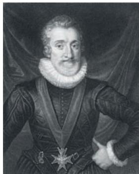
Henri IV gravure 1833

Henri IV (1553-1610), par l’édit de Nantes de 1598, accorde aux protestants la liberté d’exercer leur religion et rétablit la paix religieuse.