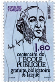
Jules Ferry © 123.fr - FRANCE - CIRCA 1981

Jules Ferry, ministre de l'Instruction publique au début des années 1880 est à l'origine de l'enseignement public, gratuit et laïc.