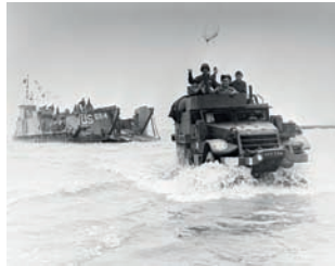
Le débarquement des alliés en Normandie, le 6 juin 1944, est une étape décisive dans la libération de la France.

Adolf Hitler, dictateur nazi au pouvoir en Allemagne, déclenche la Seconde Guerre mondiale. Il envahit notamment la France. Les nazis mènent des persécutions contre des opposants politiques, et exterminent des millions de Juifs, Tziganes, homosexuels et handicapés. Les historiens estiment que la guerre a fait plus de 50 millions de morts, dont une majorité de civils. Le 8 mai est un jour férié en commémoration de la fin de la Seconde Guerre mondiale.