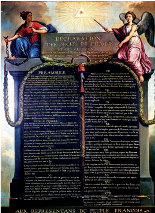
La déclaration des droits de l'homme et du citoyen, 1789

La loi accorde les mêmes droits aux femmes et aux hommes.