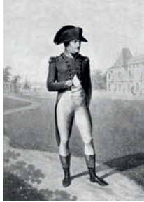
Napoléon 1 er gravure

(1769-1821) dirige la France pendant près de 15 ans. Il mène de nombreuses guerres en Europe. On lui doit notamment le Code civil.