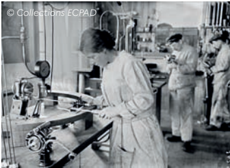
Femmes travaillant dans un arsenal à la fabrication d'obus et de roues.

Affrontement de masse touchant toute l'Europe puis les États-Unis. Les combats ont fait plus de 9 millions de morts. Le 11 novembre est un jour férié en commémoration de la fin de la Première Guerre mondiale.