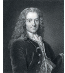
Voltaire gravure

Les philosophes des Lumières Rousseau, Voltaire, Diderot, combattent à travers leurs œuvres pour la tolérance et la liberté de pensée.