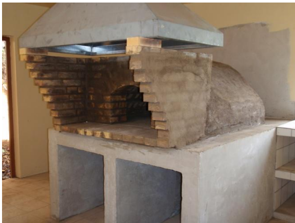
Four à pain

Au village d'Area on dénombre environ 30 habitations. La municipalité a fait d'importants efforts d'aménagements du village : rénovation du réseau d'eau, électrification, implantation d'une cabine téléphonique, bétonnage de la rue principale.